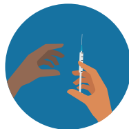
Sharing Needles to Inject Drugs