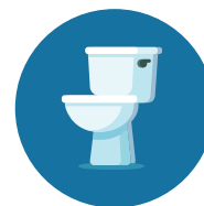
Al compartir el inodoro, los alimentos o las bebidas