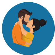
Saliva, Sweat, Tears, or Closed-Mouth Kissing