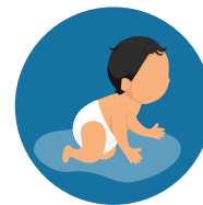
De madre a hijo durante el embarazo, el parto o la lactancia materna