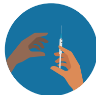
Al compartir las agujas para inyectarse drogas