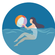
A través del aire o del agua