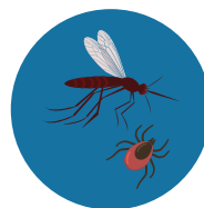
Por los insectos o por las mascotas