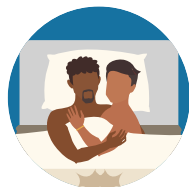
Mediante el contacto sexual